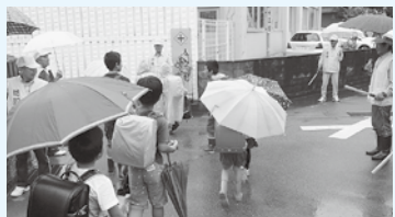
子どもたちの見守り活動

私たちの活動で地域の皆さんの防犯意識が高まり、地域住民の自主的な防犯行動が広がり、犯罪が発生しにくいまちづくりができたと思っています。